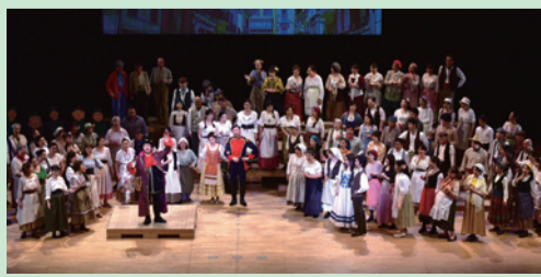
CITTADINO歌劇団第18期生公演より

● CITTADINO 歌劇団のプロフィール CITTADINO (チッタディーノ) とは、イタ リア語で「市民」という意味。平成12年 度より区民参加オペラとしてキャストと合唱 団を広く公募し、「アイダ」「カルメン」「トゥ ランドット」等上演。平成30年度は第 19期生となり、受講生は8月から平成31 年2月の公演に向けてレッスンをします。