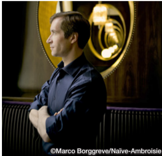
ユーリ・テミルカーノフ