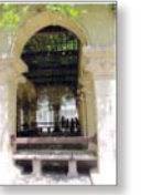
第5回 文京アカデミー賞

問 文京建築会 電話 090-1129-2194 (担当:宮本) ホームページ http://www.bunkyo-arch.org/ https://facebook.com/bunkyoehagaki