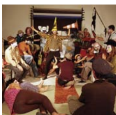
企画：廣田大樹「HARU by Hija Bastarda」

◆「第6回展覧会企画公募」(~2/26) 足利 広、実験音楽とシアターのためのアンサンブル、廣田大樹、チームやめよう ※開館時間11:00-19:00(入場は閉館30分前まで)