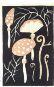
きのこ 大正3~4年 千代紙/木版