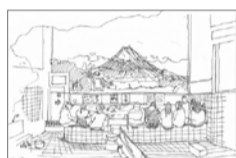
文京アカデミー賞