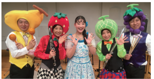
ひとみ姫&シエナ☆フルーツ音楽隊

全席指定 2,800円 一般発売 8/16(日) 10:00~ / 8/17(月) 10:00~