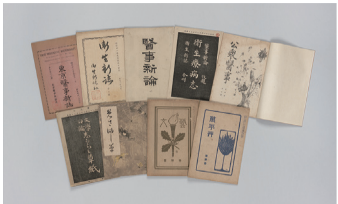
鷗外がつくった雑誌の数々