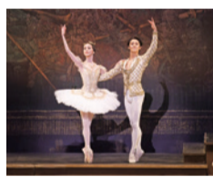
牧阿佐美バレエ団「ライモンダ」より

10月31日(土)18:30開演、11月1日(日)15:00開演 大ホール 指揮 湯川紘恵 演奏 東京交響楽団MIRAI 出 牧阿佐美バレエ団 演 オープニング、「飛鳥」第2幕より、「ライモンダ」第3幕、「火の鳥-Ember」(新作/振付:大石裕香) 全席指定 S席14,000円 A席11,000円 B席8,000円 C席5,000円 S席ペア25,000円 A席ペア20,000円 B席ペア14,500円 ※ペア席は2階席のみ。※エコノミー席 3,000円は、9/30(水)よりバレエ団オフィシャルチケットでのみ販売。座席選択不可。 ※4歳未満入場不可。 チケット発売中