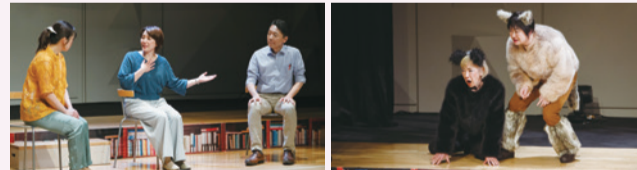
2025年度公演「BUNGEIスペシャルデイズ」より