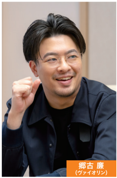
郷古 廉 (ヴァイオリン)