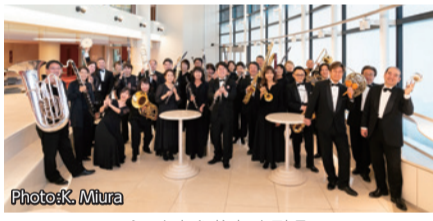
シエナ・ウインド・オーケストラ