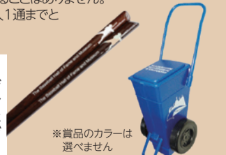
※賞品のカラーは選べません

正解者の中から抽選で、野球殿堂博物館のオリジナルグッズセット「ライン引き修正テープ&かっこばし」を10名様にプレゼント