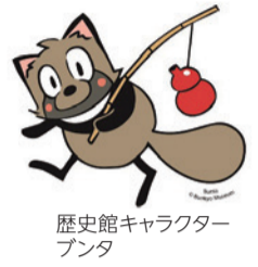
歴史館キャラクター プンタ