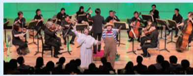
2025年公演 音楽劇「オオカミ少年」より