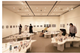
〈過去の展示の様子〉