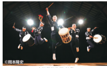
太鼓芸能集団 鼓童

7月25日(土) 14:00開演 小ホール 太鼓芸能集団 鼓童 全席指定 3,000円