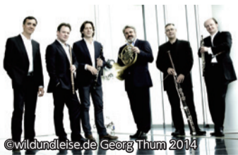
レ・ヴァン・フランセ

11月24日(火)19:00開演 大ホール 出 エマニュエル・パユ(フルート)、フランソワ・ルルー(オーボエ)、ポール・メイエ(クラリネット)、ラドヴァン・ヴラトコヴィチ(ホルン)、ジルベール・オダン(バソーン)、エリック・ル・サーージュ(ピアノ) 曲 エスケージュ/メカニック・ソング、タフネル/木管五重奏曲 モーツァルト/ピアノと管弦楽のための五重奏曲、プーランク/六重奏曲 ほか 全席指定 S席6,000円 A席5,000円 B席4,000円(学生割引) S席3,000円 A席2,500円。7/28(火)よりシビックチケットでのみ受付。 チケット発売中