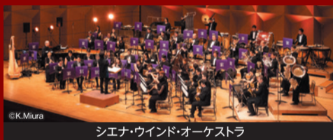
シエナ・ウインド・オーケストラ

シビックチケット 03-5803-1111 (10:00~19:00 土・日・祝休日も受付)