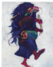
日本画・深作三匹獅子舞 岡本真由蘭

内 首都圏に残る民俗文化・芸能・まつりを描いた作品と、都内・区内に残る戦争被災樹木を写生した作品を展示