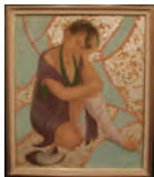
区長賞(日本画) 「チャレンジ」 安達美登里