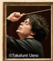
アンドレア・バッティストーニ

出演 指揮=アンドレア・バッティストーニ (東京フィル首席指揮者) ソプラノ=木下美穂子 メゾソプラノ=清水華澄 テノール=小原啓楼 曲目 ビゼー/歌劇『カルメン』より 「ハバネラ〜恋は野の鳥」 プッチーニ/歌劇『蝶々夫人』より 「ある晴れた日に」 モーツァルト/歌劇『フィガロの結婚』より 「恋とはどんなものかしら」 プッチーニ/歌劇『トゥーランドット』より 「誰も寝てはならぬ」 チャイコフスキー/ 幻想序曲「ロメオとジュリエット」 大序曲「1812年」