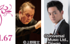
ミハイル・プレトニョフ