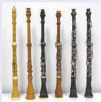
オーボエ(パロク〜現代)

軍楽隊の楽器ズルナは、トルコからヨーロッパに渡りシヨームという楽器になり、中世ルネサンス時代に演奏されました。17世紀末、軍楽隊において野趣溢れる演奏だけでなく、室内楽で繊細な演奏も出来るオーボエが登場し、これを現代ではパロクオーボエと呼びます。パロク時代、プロフェッショナルな楽器としてオーケストラの花形楽器の地位を得ました。モーツァルト時代になると楽器の内径が細くなり、古典派の軽快さを表現出来るクラシカルオーボエとなります。19世紀ロマン派になると楽器本体に沢山の穴が開けられ、開閉装置の連結を工夫することで半音階が簡単に演奏出来るロマンティックオーボエへと変わりました。さらにトリエベル兄弟のアイデアにより作られた現代のオーボエは、世界中で使われ、ギネスブックの中で一番難しい木管楽器に認定されています。オーボエ族には、五度下の音域まで出るオーボエ・ダ・カッチャやコール・アンブレ等もあります。