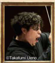
アンドレア・バッティストーニ

出演 指揮=アンドレア・バッティストーニ (東京フィル首席指揮者) ピアノ=清水和音 曲目 ヴェルディ/歌劇『運命の力』序曲 ショパン/ピアノ協奏曲第1番 ムソルグスキー(ラヴェル編)/ 組曲「展覧会の絵」