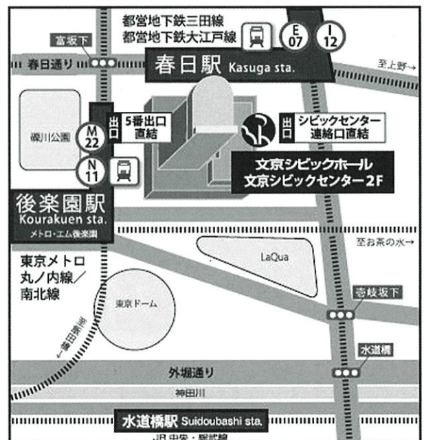
文京シビックホール小ホール アクセスマップ

石原裕次郎のイメージを決定的にした記念碑的な作品である。1958年の正月映画として公開され、総配収3億5,600万円(当時の平均入場料62円)を超える大ヒットとなり、1954年に製作を再開した日活にとって、その後を決定づけた作品である。監督の井上梅次は新東宝からの移籍組だが、裕次郎が指を負傷してドラムを叩くことができず、とっさにマイクを握って歌い始めるというツボを押さえた演出で観客を楽しませ、この一代の大スターの誕生を導き出した。