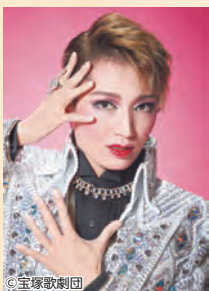
望海風斗 ※この写真は公演のものとは異なります

3年ぶりの宝塚歌劇文京シビックホール公演。圧倒的な歌唱力が魅力の雪組トップスター望海風斗が日本のミュージカル界を牽引する井上芳雄氏、世界的なミュージカルスター、ラミン・カリムルー氏を特別ゲストに迎え、エンターテインメント溢れるコンサートをお届けします。