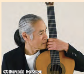
荘村清志

文京区で生まれ一時期を過ごした、文京区ゆかりの作曲家・武満徹。生前より深い親交のあった荘村清志による、武満徹生誕90年を記念したギターリサイタル。様々な逸話を交えながらおくりします。