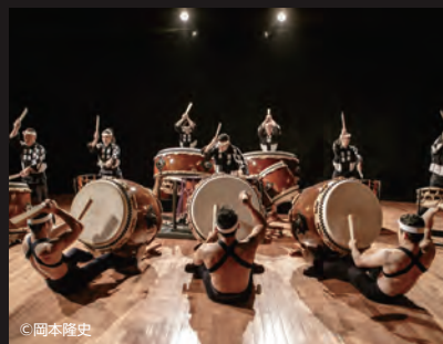
太鼓芸能集団 鼓童