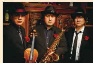
左から、石田泰尚、松原孝政、中岡太志

圧倒的な存在感を放つカリスマ・ヴァイオリニスト石田泰尚をはじめ、実力派人気演奏者による異色トリオが粋に捕られないアグレッシブな演奏をお届けします。