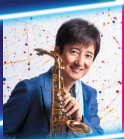
サクソフォン 本田雅人

~サクソフォン奏者 本田雅人を迎えて~ TAKARAJIMA / TRUTH (BUNKYO SIENA POPSスペシャル)