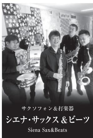
サクソフォン & 打楽器 シエナ・サクセス & ビーツ Siena Sax & Beats

シエナ・ウインド・オーケストラが提案する新発想ユニット。これまで様々なニーズに応え各所で演奏活動を行ってきた「シエナ・サクセス」。このカルテットにドラムセットとパーカッションを加えパワーアップした6人で構成されるのが「シエナ・サクセス&ビーツ」。楽器の歴史としては比較的浅いサクセスに音楽の原点といわれるリズムを担当する打楽器をプラスすることで、バロックからマーチ、ラグタイム、ジャズ、ラテン等リズムの変遷を辿るレパートリーは変化に富み、世代を超えて楽しむことができます。本公演では、須川展也さんを迎えてのサクセス・カルテットおよびビーツを加えた6人による、スペシャル・コラボでお届けします。