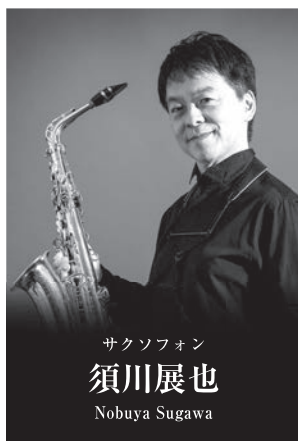
サクソフォン 須川展也 Nobuya Sugawa

日本が世界に誇るクラシカル・サクソフォン奏者。長きにわたり、チック・コリア、ファジル・サイ、坂本龍一、西村朗、本多俊之、吉松隆、長生淳など、名だたる作曲家への委嘱を継続。国際的に広まっている楽曲が多くあり、クラシカル・サクソフォンの領域への貢献は計り知れない。国内外の著名オーケストラと多数共演。ウィーンの本ジークフェラインをはじめ30ヶ国以上で公演やマスタークラスを行う。東京藝術大学卒業。第51回日本音楽コンクール、第1回日本管打楽器コンクール最高位受賞。02年NHK連続テレビ小説「さくら」テーマ曲演奏。89-10年まで東京佼成ウインドオーケストラ・コンサートマスター、07-20年までヤマハ吹奏楽団常任指揮者を務める。トルヴェール・カルテットのメンバー、東京藝大招聘教授、京都市立芸大客員教授。