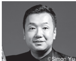
トロンボーン 中川英二郎 (*) Eijiro Nakagawa

5歳でトロンボーンを始め、高校在学中に初リーダー作をニューヨークで録音。ビック・アーティストとの共演を始め、映画、CM、TVなど多くの録音でも知られる。07年には米「トニー賞」授賞式に出演し08年にはNHK連続テレビ小説『瞳』のメインテーマを演奏。18年「スライド・モンスターズ」を結成。19年「International Jazz Day」出演。国内主要オーケストラとも共演を重ねるなどジャンルを超えた多彩な才能を発揮し、日本を代表する世界的トロンボーン奏者として幅広い活動を行っている。