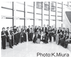
吹奏楽 シエナ・ウインド・オーケストラ Siena Wind Orchestra

1990年に結成されたプロのウインド・オーケストラ。現在、文京シビックホールを拠点に演奏活動を展開し高い人気を誇っている。佐渡裕を首席指揮者に擁し、原田慶太楼、宮川彬良をはじめとする多彩な指揮者を客演に迎えている。また、文京区と事業提携を結び、地域や教育機関と密着した活動も展開している。テレビ朝日「題名のない音楽会」等のメディアへの出演や、CD・DVDも多数リリースしており、いずれも大きな話題を呼んでいる。