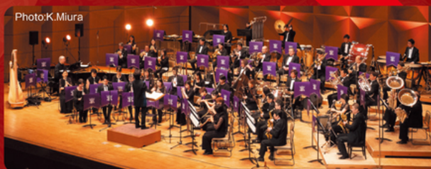
吹奏楽 シエナ・ウインド・オーケストラ