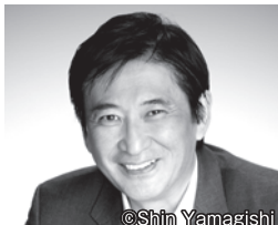
指揮 藤岡幸夫 Sachio Fujioka

英国王立ノーザン音大指揮科卒業。1994年「プロムス」にBBCフィルを指揮してデビュー以降、多くの海外オーケストラに客演。首席指揮者を務める関西フィルとは2020年に21年目のシーズンを迎え、2019年4月には東京シティ・フィル首席客演指揮者にも就任した。指揮・司会として関西フィルと共に出演中のBSテレ東『エンター・ザ・ミュージック』（毎週土曜朝8:30-）は番組開始から6年目、放送も300回に迫る。2002年渡邊暁雄音楽基金音楽賞受賞。