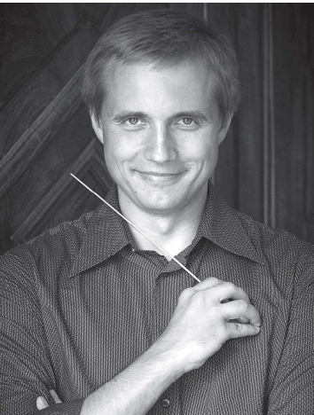
ヴァシリー・ペトレンコ (指揮) Vasily Petrenko

1976年生まれ。サンクトペテルブルク音楽院で学び、2006年にロイヤル・リヴァプール・フィルハーモニー管弦楽団の首席指揮者、2013年からはオスロ・フィルハーモニー管弦楽団の首席指揮者を務め、両楽団とレコーディングしたショスタコーヴィチをはじめとする数多くのCDは世界中で高く評価され数々の音楽賞を受賞している。これまでにベルリン・フィルハーモニー管弦楽団、ロンドン交響楽団、フランス国立管弦楽団をはじめとする世界の主要オーケストラへ数多く客演、2021年のシーズンからイギリスのロイヤル・フィルハーモニー管弦楽団の音楽監督に就任している。若手の育成にも力を注いでおり、EUユース・オーケストラの首席指揮者も務めている。