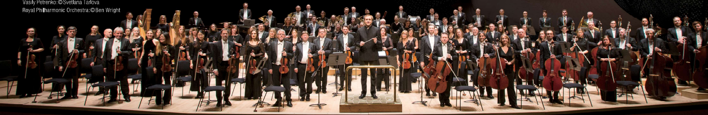
Nobuyuki Tsujii Vasily Petrenko Royal Philharmonic Orchestra

2023 5.24 (水) 19:00開演 (18:15開場) 文京シビックホール 大ホール