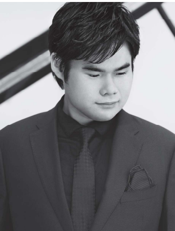
辻井伸行 (ピアノ) Nobuyuki Tsujii

1946年にサー・トーマス・ビーチャムが設立。ロイヤルの称号を英国王室から許可されたイギリスを代表するオーケストラである。ロンドンを拠点に、クラシックの演奏会のほかにサウンドトラックのレコーディングやポップスターとの共演など、年間200公演を超えるコンサートを開催し、幅広いファンを獲得している。歴代の首席指揮者は創設者サー・トーマス・ビーチャムを皮切りに、アンドレ・プレヴィン、ウラディミール・アシュケナージ、シャルル・デュトワなど、世界的な名指揮者が務めており、2021年のシーズンからは、CDが世界中で高い評価を受けているヴァシリー・ペトレンコを音楽監督に迎え、ロンドンのオーケストラ界でもっとも注目を集める存在となっている。