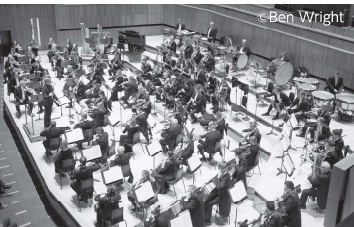
Royal Philharmonic Orchestra (RPO)

1946年にサー・トーマス・ビーチャムが設立。ロイヤルの称号を英国王室から許可されたイギリスを代表するオーケストラである。ロンドンを拠点に、クラシックの演奏会のほかにサウンドトラックのレコーディングやポップスターとの共演など、年間200公演を超えるコンサートを開催し、幅広いファンを獲得している。歴代の首席指揮者は創設者サー・トーマス・ビーチャムを皮切りに、アンドレ・プレヴィン、ウラディミール・アシュケナージ、シャルル・デュトワなど、世界的な名指揮者が務めており、2021年のシーズンからは、CDが世界中で高い評価を受けているヴァシリー・ペトレンコを音楽監督に迎え、ロンドンのオーケストラ界でもっとも注目を集める存在となっている。