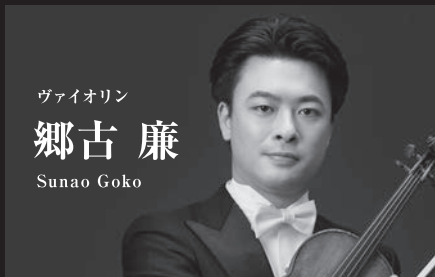
ヴァイオリン 郷古 廉 Sunao Goko

ソリストとN響第1コンサートマスター、二刀流で音楽を極めるヴァイオリニスト。2013年ティボー・ヴァルガ国際ヴァイオリン・コンクール優勝ならびに聴衆賞・現代曲賞を受賞。現在、国内外で最も注目されている若手ヴァイオリニストのひとりである。1993年、宮城県多賀城市生まれ。2006年第11回ユーディ・メニューイン青少年国際ヴァイオリンコンクールジュニア部門において史上最年少で優勝。2007年12月のデビュー以来、各地のオーケストラと共演。2017年より3年かけてベートーヴェンのヴァイオリン・ソナタ全曲を演奏するシリーズにも取り組んだ。これまでに勅使河原真実、ゲルハルト・ボッセ、辰巳明子、バヴェル・ヴェルニコフの各氏に師事。ジャン・ジャック・カントロフ、アナ・チュマチェンコの各氏のマスタークラスを受ける。使用楽器は1682年製アントニオ・ストラディヴァリ(Banati)。個人の所有者の厚意により貸与される。2019年第29回出光音楽賞受賞。2024年4月よりNHK交響楽団第1コンサートマスターに就任。2025年1月よりみやぎ絆大使に就任。