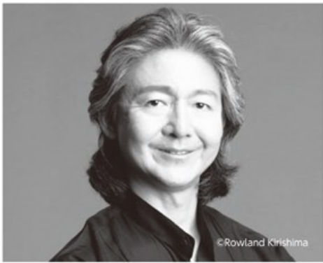
大友直人 Naoto Otomo 指揮

桐朋学園大学を卒業。指揮を小澤征爾、秋山和慶、尾高忠明、岡部守弘各氏に師事した。桐朋学園大学在学中からNHK交響楽団の指揮研究員となり、22歳で楽団推薦により同団を指揮してデビュー。現在、群馬交響楽団音楽監督(～2019年3月)、東京交響楽団名誉客演指揮者、京都市交響楽団桂冠指揮者、琉球交響楽団音楽監督。また、2004年から8年間にわたり、東京文化会館の初代音楽監督を務めた。