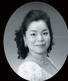
メゾ・ソプラノ 中島郁子* [特別出演]