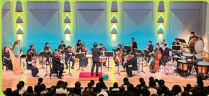
とうきょう 東京フィルハーモニー交響楽団の メンバーによるミニオーケストラ