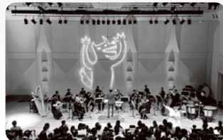
2025年公演音楽劇「オオカミ少年」より