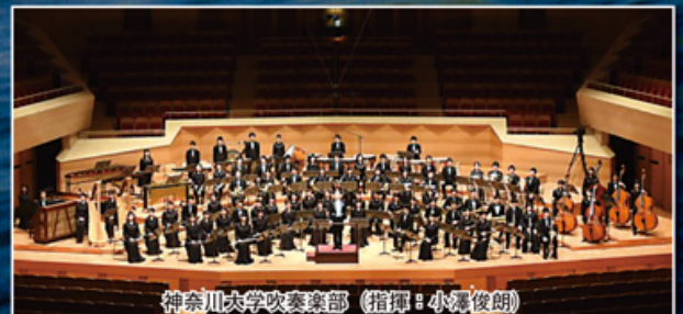
神奈川県立吹奏楽部 (指揮：小川俊朗)

主催：「21世紀の吹奏楽」実行委員会 ■ホームページ http://kyo-en.music.coocan.jp/ 共催：文京シビックホール (公益財団法人文京アカデミー)